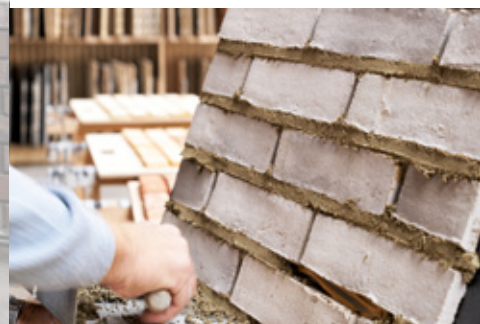
In unserem Showroom erwarten Sie über 670 Mustertafeln und 48 Pflasterflächen.